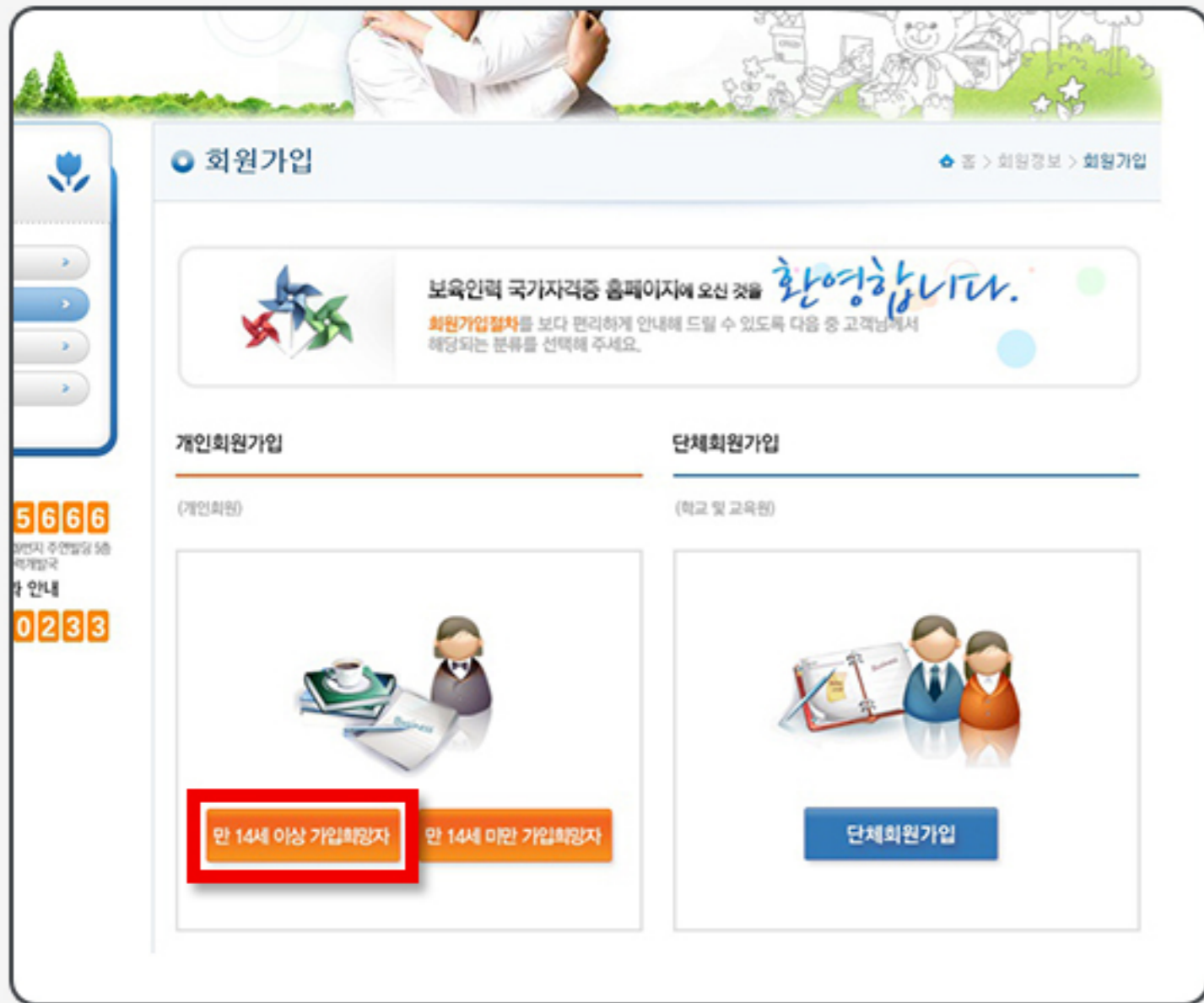
1 클릭 (만 14세 이상 가입희망자)